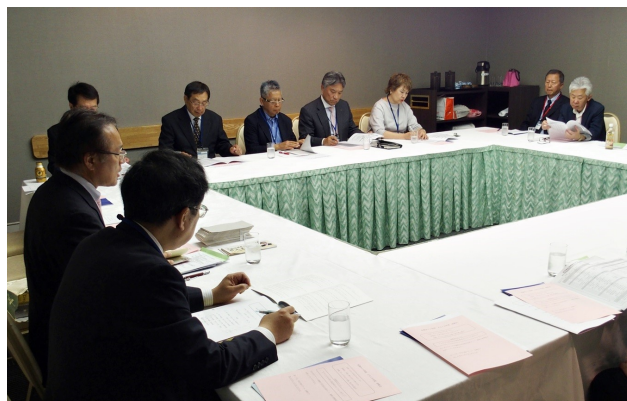
4月21日開催の私塾ネット代表者会議風景